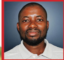
Abubakar Mtaalamu wa kilimo